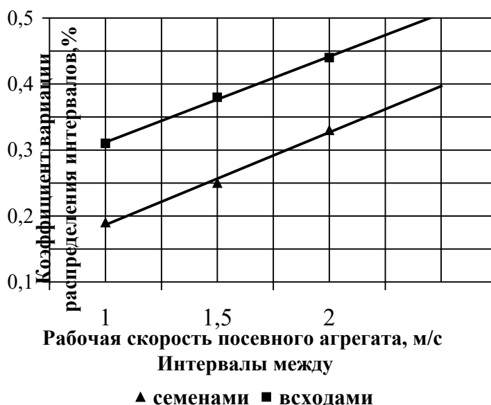
Рисунок 3 - Влияние скорости посевного агрегата на коэффициент вариации интервалов.

В процессе посева с заданным интервалом между семенами на формирование последовательности размещения систематическое влияние оказывают случайно изменяющиеся во времени свойства почвы по длине рядка и условия для произрастания семян. В зависимости от точности работы высевающего аппарата и стабильности почвенных условий интервалы между семенами и между растениями обладают свойствами случайной последовательности. Поэтому для математического описания интервалов между семенами и растениями, анализа и синтеза технологического процесса и параметров высевающих аппаратов необходимо применять методы теории вероятностей и математической статистики. Так как интервалы между семенами и растениями случайны, то для описания их статистических свойств используют математическое ожидание, среднеквадратическое отклонение и коэффициент вариации (рисунок 3).