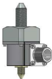
Рисунок 1 – Малогабаритный датчик давления типа МД – ТП

Остаточные напряжения условно разделяют на макронапряжения и микронапряжения. Их принципиальное отличие состоит в скорости изменения напряжений по пространственной координате. Если в пределах размера зерна материала напряжения изменяются не существенно, то их можно отнести к числу макронапряжений. Для таких напряжений вполне допустимо представление об изотропном материале. Обычные напряжения от внешних нагрузок относятся к макронапряжениям [2].