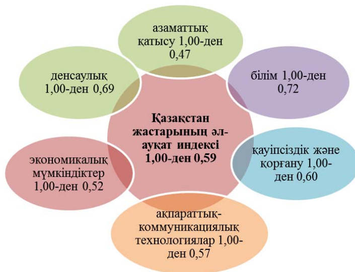
Сурет 2. Қазақстан жастарының әл-ауқат индексі санаттары бойынша маңызы

Мүмкіндік болған жерде Қазақстан бойынша деректер ЖДИ-нің түпнұсқалық есебінде пайдаланылған халықаралық дерекқорлардан алынды. Дегенмен, деректердің жоқтығынан, Қазақстан үшін он екі көрсеткіш бірегей дереккөздерден ерекшеленетін деректер базасы бойынша есептелді. Осылайша, Қазақстан үшін есептеулердің нәтижелерін түпнұсқа есепте ұсынылған елдердің бағаларымен тікелей салыстыруға болмайды. Қазақстан үшін есептеулер анықтама түрінде және бірқатар көрсеткіштер бойынша басқа елдермен салыстырғанда Қазақстанның қандай орын алуы мүмкін екендігі туралы жалпы түсінікті қалыптастыру мақсатында көрсетілген.