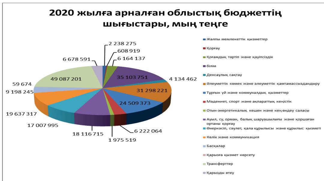
Сурет 2. 2020 жылға арналған облыстық бюджеттің шығыстары

2020 жылдың шығыстарың келесі 2 суреттең көруге болады [3].