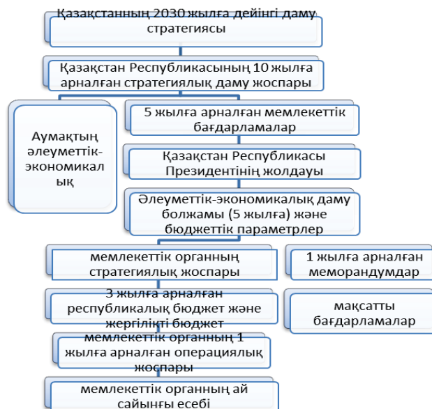
Сурет 3. Мемлекеттік жоспарлаудың жаңа жүйесі

Мемлекеттік жоспарлаудың жаңа жүйесіне келесі өзара байланысты деңгейлер кіреді (сурет 3).