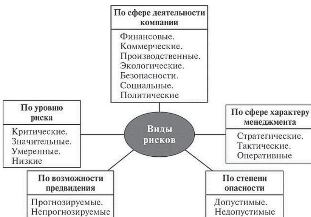
Рисунок – 3 Виды рисков

На сегодняшний день изучено несколько видов риска. Чтобы управлять риском в компании, мы классифицируем его в зависимости от различных категорий. Показано на рис. 3.