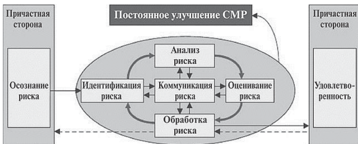
Рисунок – 2 Система управления рисками

Концептуальная модель управления рисками как составной части общего менеджмента компании реализуется в рамках системы управления рисками СМР, представленной на рис. 2.