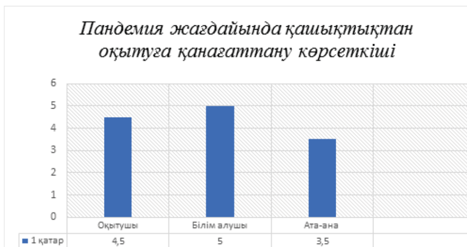
Сурет 4 - Қашықтықтан оқытудың қанағаттану көрсеткіші

Жүргізілген сауалнама бойынша орта есеппен алғанда, оқытушы мен ата-аналарға қарағанда білім алушылардың қашықтықтан оқытуға қанағаттану көрсеткіші жоғары екенін көруге болады.