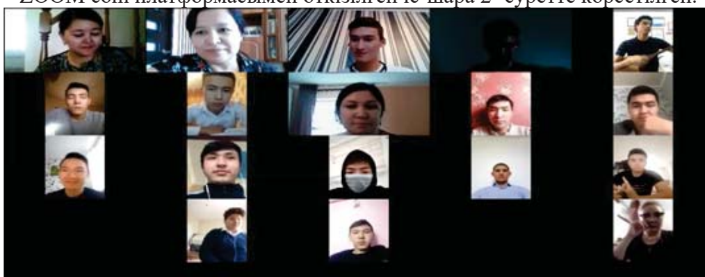
Сурет 2 - ZOOM com платформасы