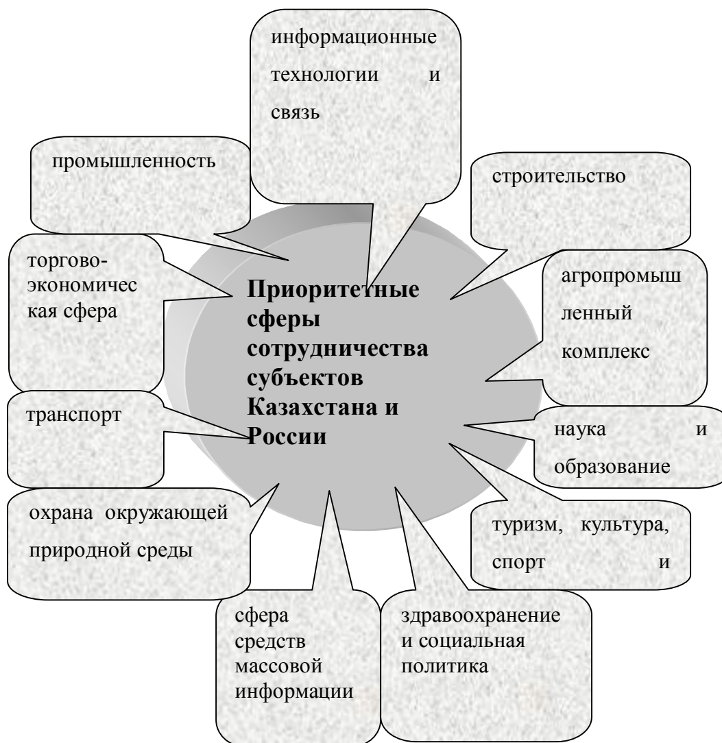
Рисунок 5 Приоритетные сферы сотрудничества субъектов РК И РФ.

Приоритетными сферами сотрудничества субъектов Российской Федерации и административно-территориальных образований Республики Казахстан являются –рисунок 5.