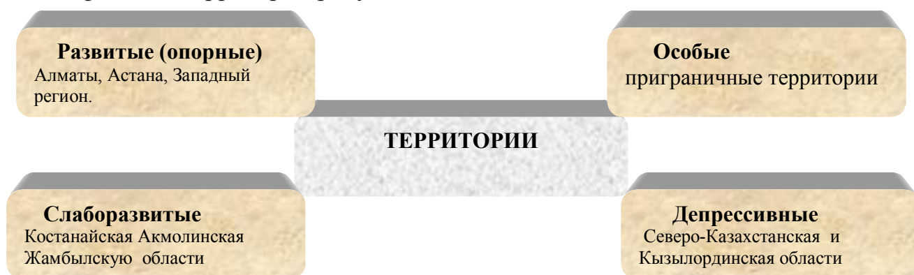
Рисунок 3- Классификация типов территории по уровню развития

В ходе исследования мы предлагаем по уровню развития следующие классификации территории рисунок 3: