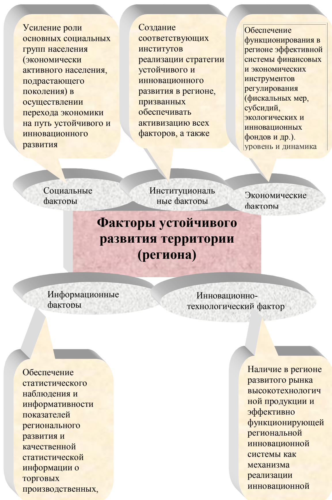
Рисунок 4 Факторы устойчивого развития региона в условиях межрегионального и приграничного сотрудничества (систематизировано автором)